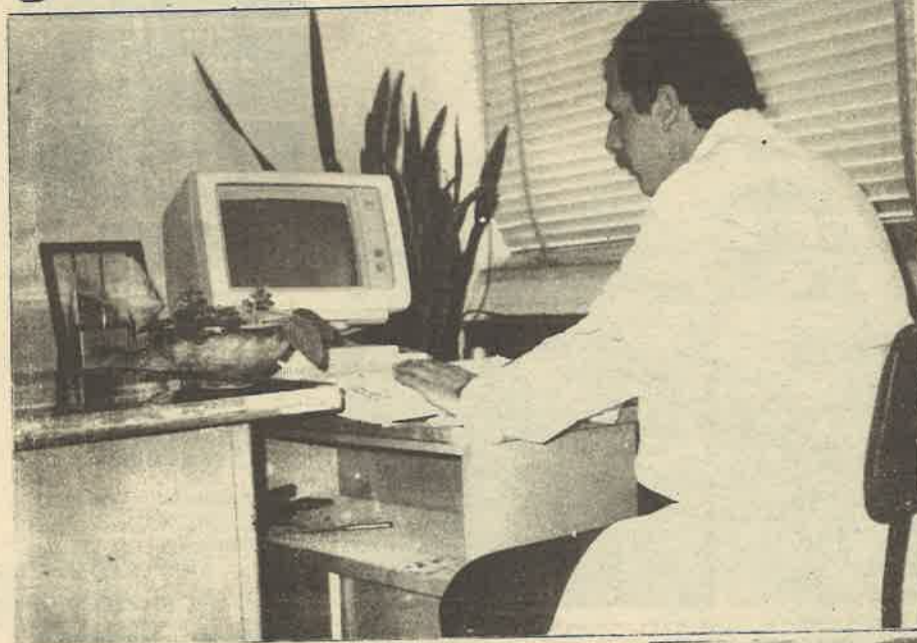
Etibank Seydişehir Alüminyum Tesisi laboratuvarlarında, il- çenin muhtelif yerlerinden alınan gaz, sıvı ve katı numuneler analiz edilerek, bilgisayara kaydediliyor. Seydişehir hava kirlili- ği problemi olmayan sanayi şehri.