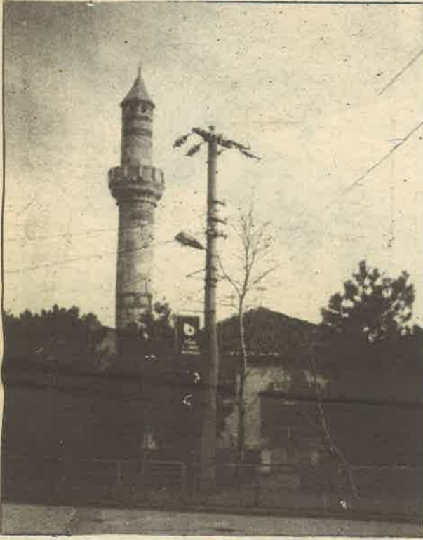
Belediyece yaptırılan çevre düzenlemesi tamamlanarak, yepyeni bir görünüş kazanan tarihi Muallimhane Camii